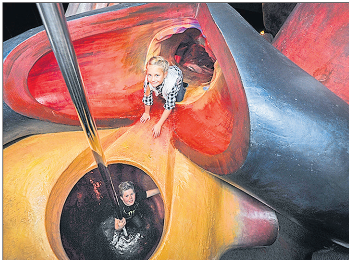
Von Beginn an eine besondere Attraktion der Kinder-Akademie: das begehbare Herz.